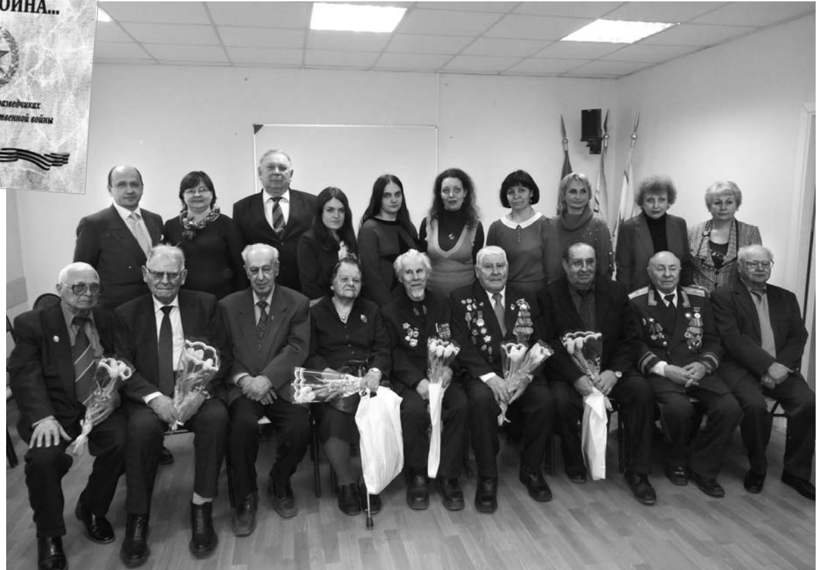
Встреча авторов сборника с ветеранами.