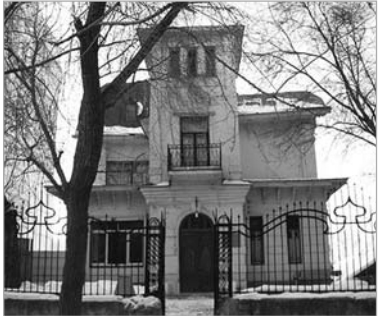
Военная миссия Великобритании, улица Степана Разина, 106.

Коммерческое офисное здание. Здесь находятся ИНКАХРАН, Самаррыбхоз, Земресурс и другие организации.