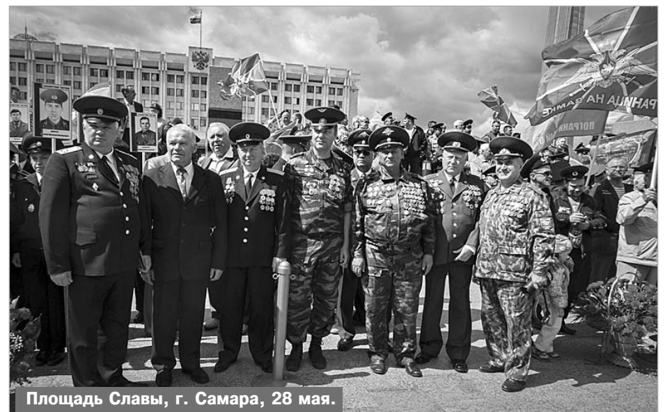
Площадь Славы, г. Самара, 28 мая.