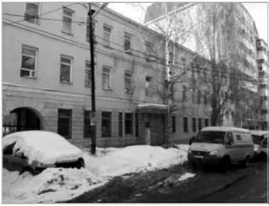
Посольство Ирана, улица Степана Разина, 130.

(Продолжение. Начало в номерах за июль - декабрь 2017 г. и январь - апрель 2018 г.)