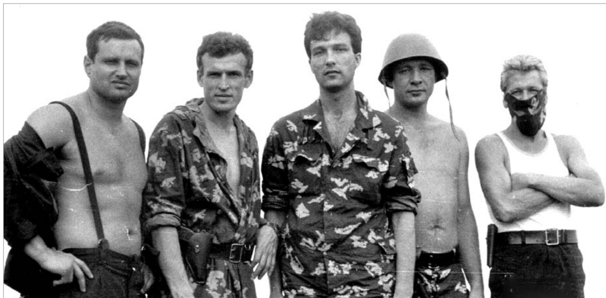
Черноречье, мая 1989 года.