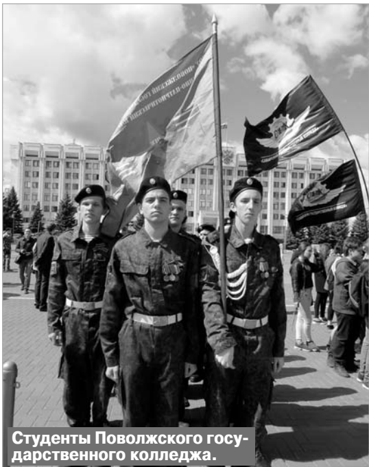
Студенты Поволжского государственного колледжа.