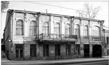
Посольство Турции, улица Фрунзе, 57.

Дом архитектора, статского советника Платона Васильевича Шаманского, построен в 1915 году. Здесь находилась и его творческая мастерская. Сегодня это многоквартирный жилой дом.