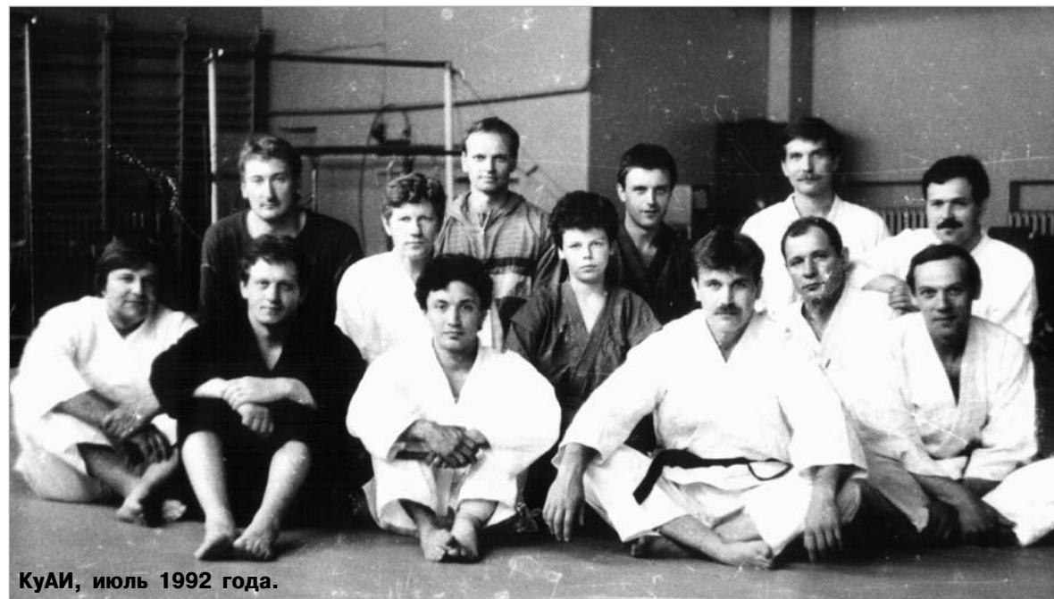
КуАИ, июль 1992 года.