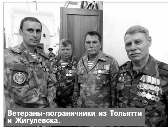
Ветераны-пограничники из Тольятти и Жигулевска.