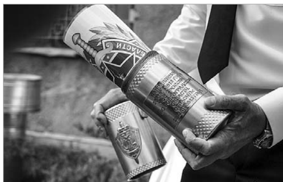
Совет ветеранов УФСБ России по Самарской области.

Поздравляем действующих сотрудников и ветеранов УФСБ России по Волгоградской области со 100-летним юбилеем! Желаем успехов в службе, во всех делах и начинаниях, крепкого здоровья и благополучия.