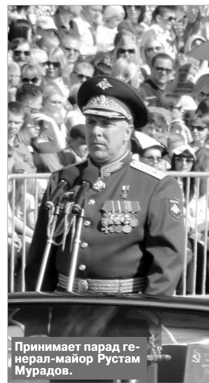
Принимает парад генерал-майор Рустам Мурадов.