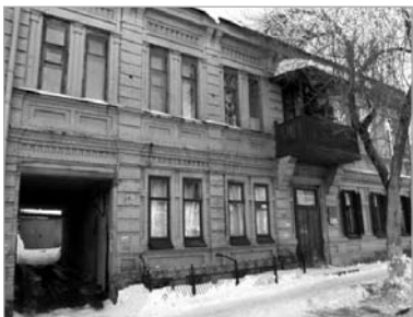
Дипломатическая миссия Братской Союзнической

Дом построен в 1917 году. В настоящее время здесь располагается «Центр развития ребёнка - детский сад № 56» городского округа Самара.