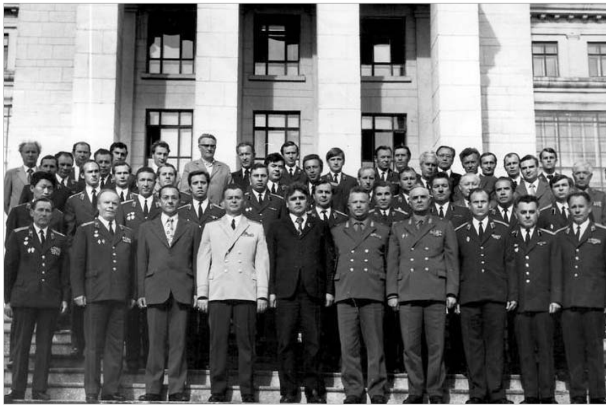
Хабаровские чекисты. 1977 год.