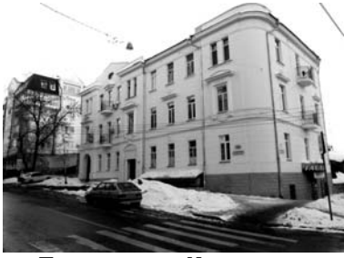
Посольство Китая, улица Степана Разина, 108/улица Ленинградская, 17.

Особняк был построен в 1900 году по заказу Фирса Наймушина, крупного лесопромышленника. Проект подготовил, известный по тем временам, архитектор Филарет Засухин. Является памятником архитектуры. Здание сгорело в 2007 году и сейчас решается вопрос о его восстановлении.