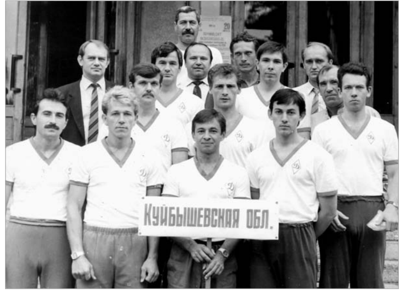
На соревнованиях в Горьком, 1988 год.