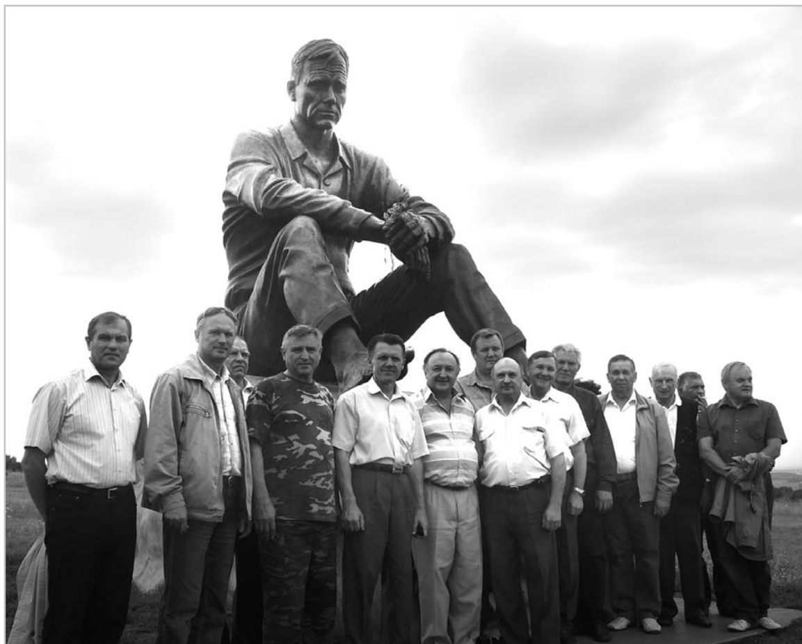
Встреча ветеранов Бийского городского отдела УКГБ. У памятника В.М. Шукшину в Сростках.

Обычная работа нашей ветеранской организации это ежемесячное проведение собраний Совета Клуба, на которых обсуждаются события, происходящие в городе, регионе и в стране, вносятся коррективы в планируемые мероприятия. Кроме того, в ходе проведения советов отмечаем дни рождения и юбилей членов Клуба, а также важные даты в истории России. По большому счету наша цель и сегодня - преумножать славные традиции органов ЧК, ВЧК-КГБ-ФСБ, внося свой вклад в дело безопасности государственной безопасности интересов России.