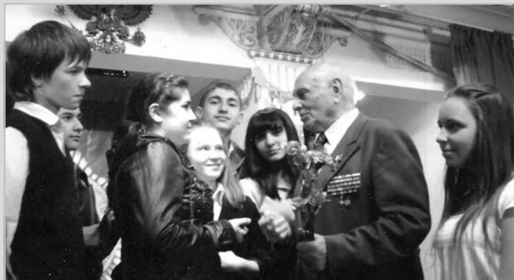
Герой России полковник Ботян Алексей Николаевич среди учащихся школы № 522.