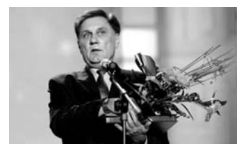
Из газеты «Бийский рабочий»