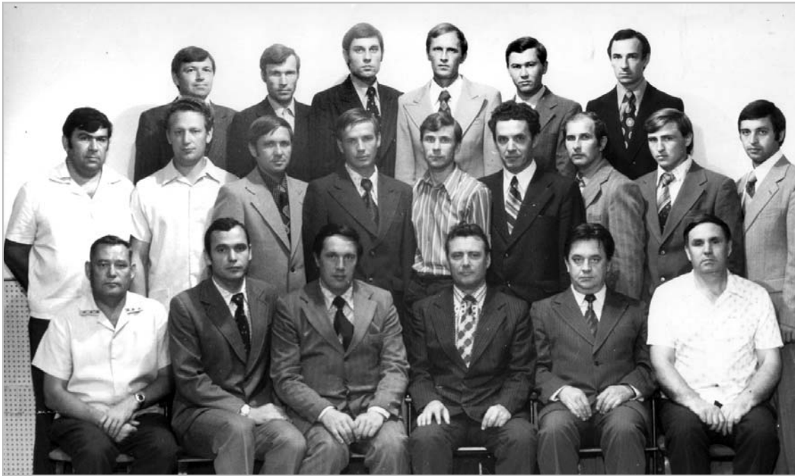
Бийский городской отдел 1978 год.

Высылаю старые фото. Многие сотрудники горотдела в 1970-1979 годах окончили или Минскую школу, или Ташкентские курсы. Футбольная команда отдела. За период с 1977 года по 1982 г. (до моего