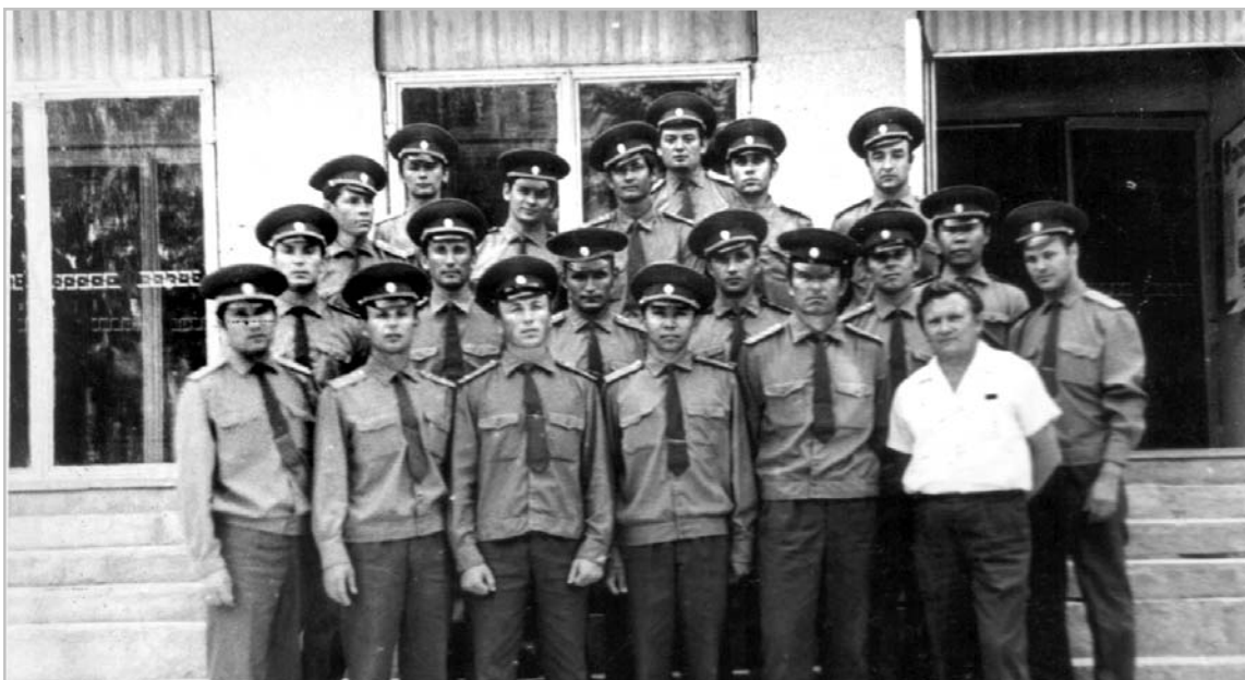
Ташкент, 1976 год. Февральский набор.

Химкомбината. Дважды сыграли вничью со сборной Управления в 1979 г. и в 1988 г. Оба раза со счётом 2:2. Вот такими мы были. Все, кто дружили со спортом достойно закончили службу в органах.