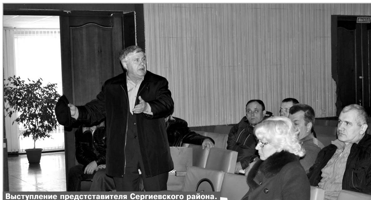
Выступление представителя Сергиевского района.