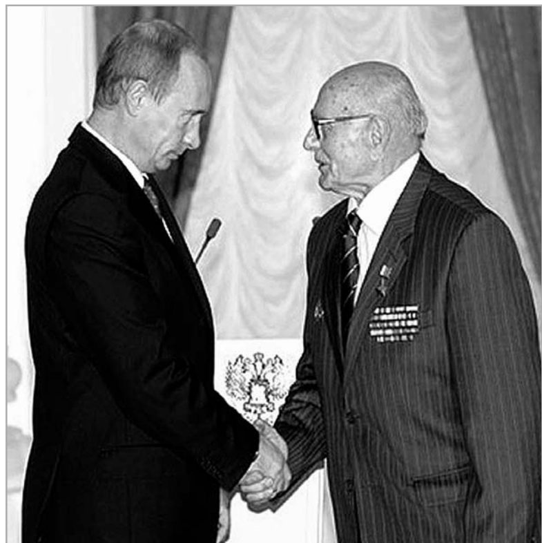
22 мая 2007 года. Москва. Кремль. Церемония вручения государственных наград.