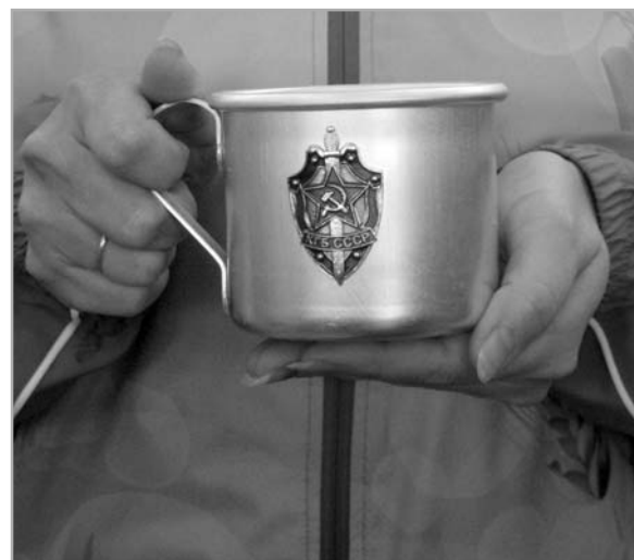
Армейская кружка с чекистской символикой.

Командам-участникам соревнований и отличившимся спортсменам от имени Совета