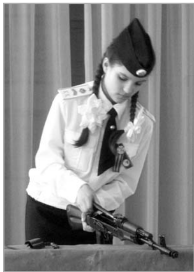
Сборка автомата. Похвистнево, школа № 3.

20 декабря, в день празднования 99-й годовщины образования ВЧК-КГБ-ФСБ, воспитанники кадетских классов пограничной направленности школы № 3 г. Похвистнево отчитались о своих результатах в учебе. Девяносто воспитанников кадетских классов подошли к окончанию первого полугодия с положительными итогами.