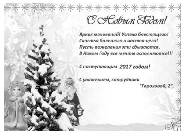
Открытка от Музея политической истории «Гореховая, 2», Санкт-Петербург.