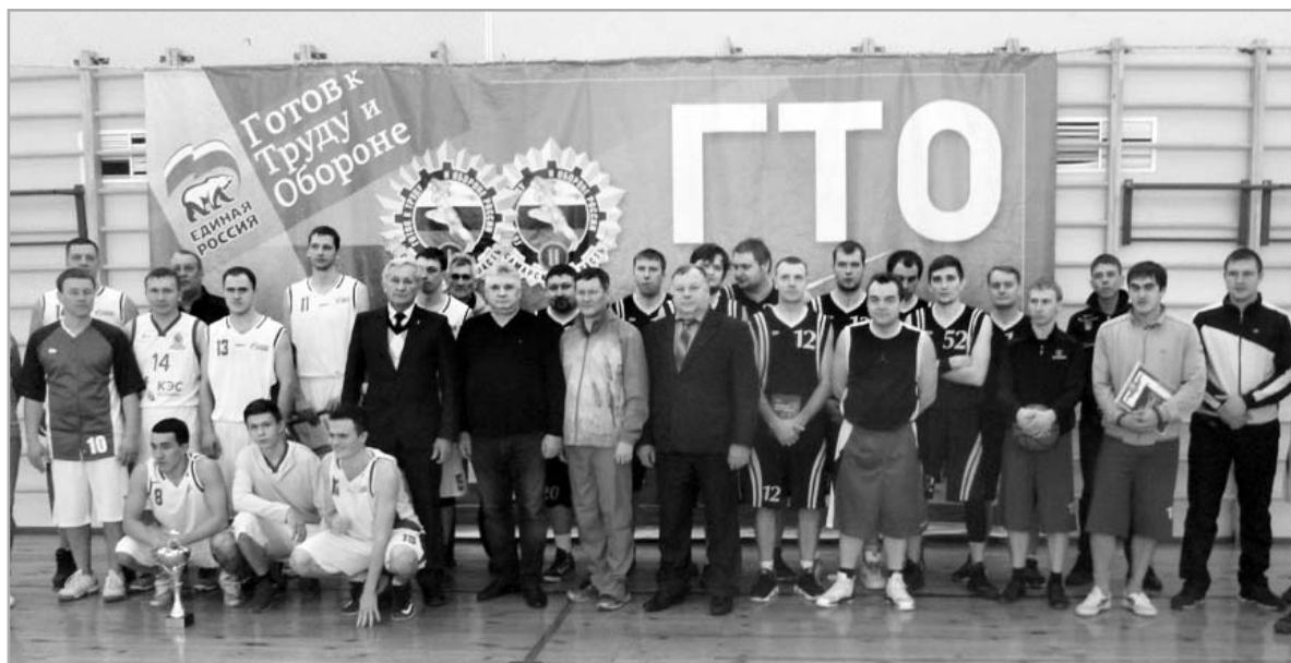
Финалисты турнира по баскетболу. Подбельск, 2016 г.

ветеранов управления ФСБ России по Самарской области была вручена авторская книга легендарного самарского контрразведчика Сергея Гергиевича Хумарьяна «Разведка и контрразведка: лица одной медали». Этот турнир в определенной степени был посвящен памяти чекиста Сергея Хумарьяна и других малоизвестных и совсем неизвестных, по понятным причинам, чекистов.