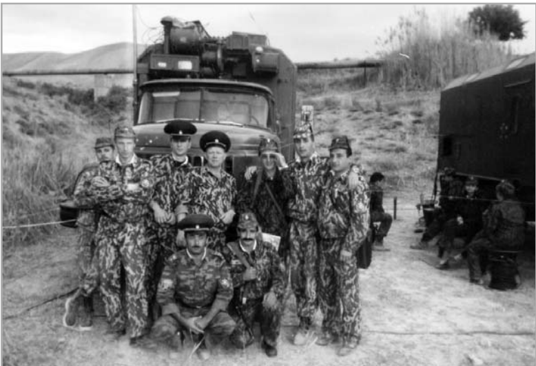
1997 г. С командованием Арташатского отряда.