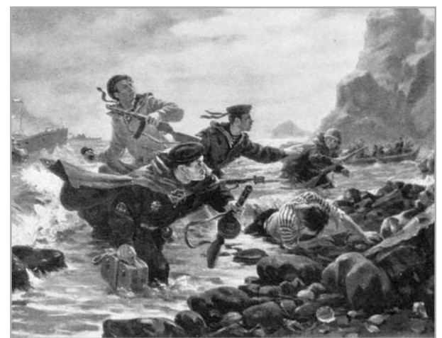
Взяли с боями Шумшу, Итуруп, Парамушир, Шикотан и Уруп - Сломлен японский восточный редут.