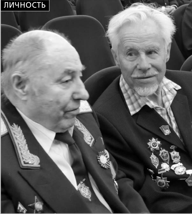
Данько А.Е. и Коренченко В.И. 7 мая 2015 г.

Генерал - майор, военный контрразведчик Данько Александр Егорович (21.04.1930 г. - 17.12.2015 г.) уроженец Оренбургской области, сын погибшего фронтовика, выпускник Ташкентского танкового училища. С 1956 по 1990 гг. он служил в Особых отделах КГБ СССР и прошел путь от оперуполномоченного до начальника ОО КГБ СССР по войскам Юго-Западного направления.