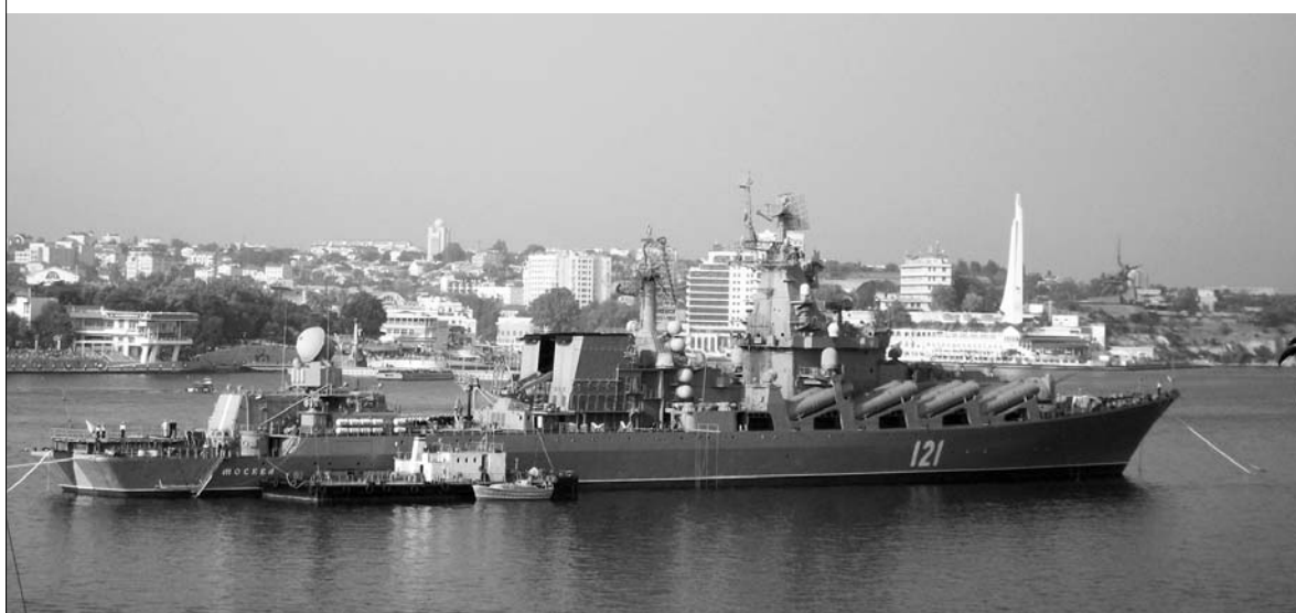
Флагман Черноморского флота ракетный крейсер «Москва».

г. Самара - г. Севастополь, июль 2016 г.