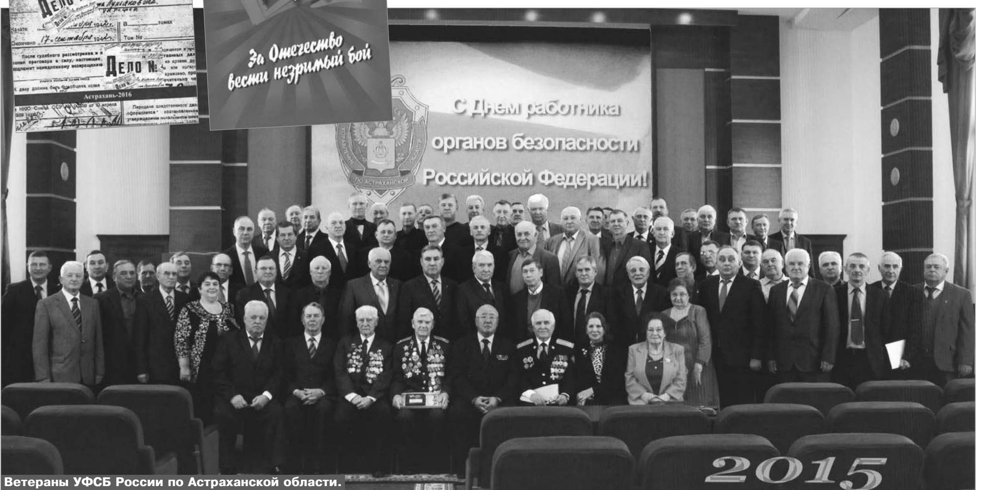
Ветераны УФСБ России по Астраханской области.