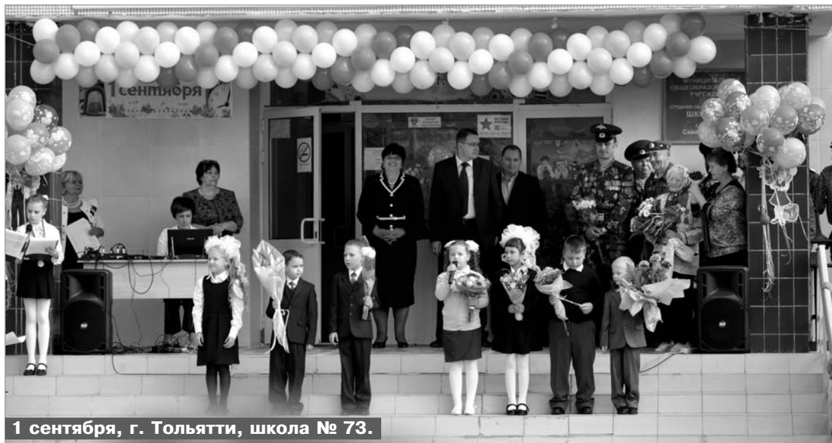
1 сентября, г. Тольятти, школа № 73.