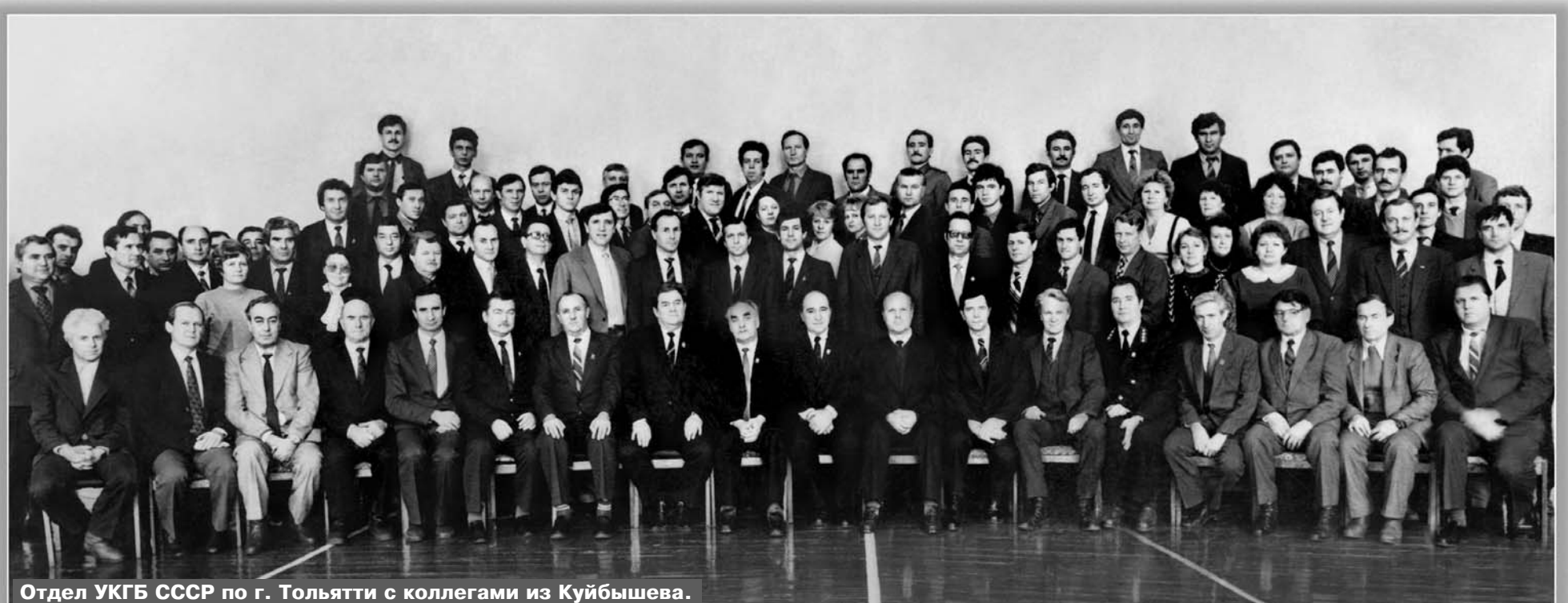
Отдел УКГБ СССР по г. Тольятти с коллегами из Куйбышева.