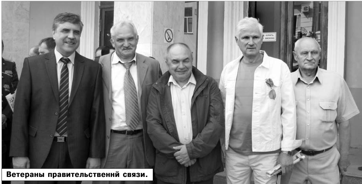
Ветераны правительственной связи.

В эти годы активно создавалась новая техника для обеспечения связи в полевых условиях . С этой целью первоначально разработаны портативные системы передачи, маскирующая (в дальнейшем и шифрующая) аппаратура, коммутаторы, средства электропитания и иная техника. Затем на их базе, с учётом опыта войны, были созданы мобильные аппаратные станции, после оснащения которыми, войска правительственной связи, кроме выполнения функций линейной службы, стали самостоятельно