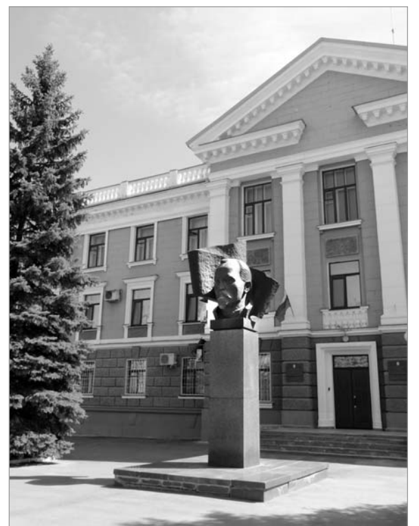
Чебоксары. Памятник Ф. Дзержинскому.

ка средств не появлялись почти год, надеемся, что возможность выпустить летние тематические выпуски все-таки появится, и мы восполним