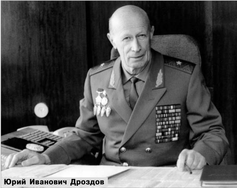
Юрий Иванович Дроздов

Для меня книга Ю. Дроздова вдвойне знаменательная. Во-первых, с ее автором, Юрием Ивановичем Дроздовым, я встречался в стенах ПГУ КГБ СССР (ныне СВР России), во-вторых, это последний подарок мне от Сергея Георгиевича Хумарьяна. «Тебе она будет нужнее. Да и читать мне ее тяжело», - сказал он мне тогда. Последние полтора-два года читал он через увеличительное стекло и очень переживал по этому поводу.