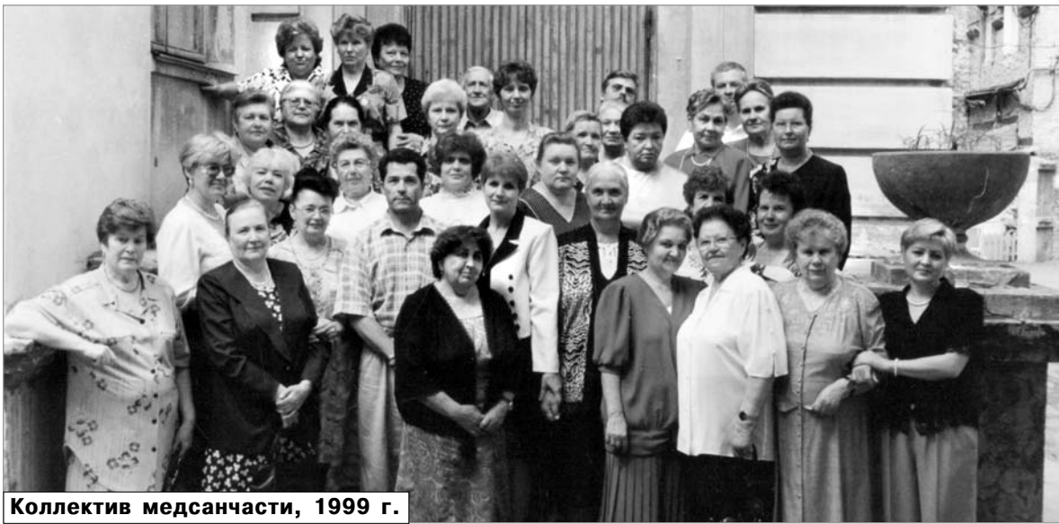
Коллектив медсанчасти, 1999 г.