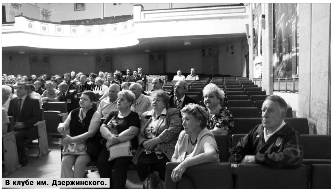
В клубе им. Дзержинского.