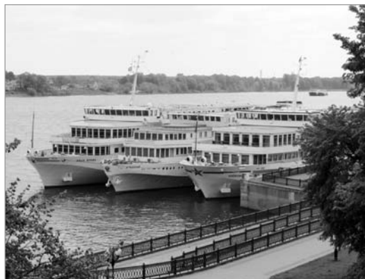
В порту Ярославля.

К сожалению, никак не удастся пообщаться в живую с коллегами из Чувашии. В прошлом году мы туда не попали, потому что нам изменили маршрут, в этот раз в Чебоксары мы прибыли в выходной день. Но по городу прогулялись с удовольствием, прошли мимо здания УФСБ на пр. К. Маркса 43,