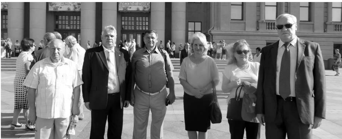
Наши ветераны на празднике.