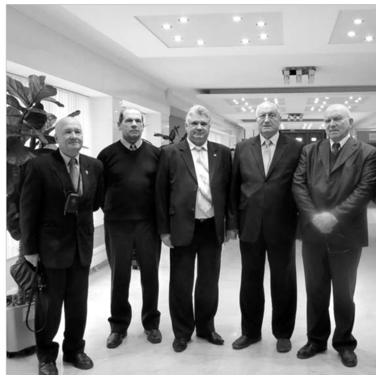
Ветераны-чекисты - участники конференции.