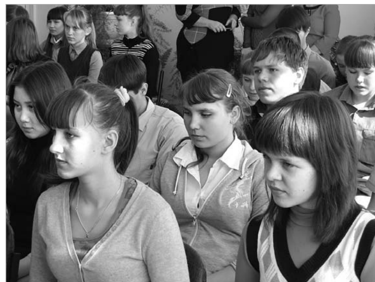
Учащиеся Кабановской средней школы Кинель-Черкасского района.

Совет ветеранов УФСБ России по Самарской области, общественная организация «Ветераны-пограничники Самарской области», ветераны-пограничники Тольятти, Чапаевска поздравляют педагогические коллективы и учащихся школ № 50, 139, 170 г. Самара, № 10 и 13 г. Чапаевска, № 13, 32, 73, 88, гимназии № 35 и техникума промышленных технологий г. Тольятти, а также школы села Кабановка Кинель-Черкасского района, Отдел образования и школы Похвистневского района. Желаем отличных результатов и постоянного интеллектуального роста. Поздравляем также всех мам, пап, бабушек и дедушек, провожающих в школу своих детей и внуков. Пусть новый учебный год будет успешным!