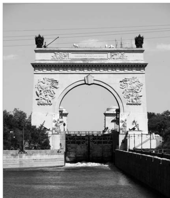
Один из шлюзов Волго-Донского канала.

Уже готова подборка фотографий мест, где удалось побывать. Есть фото с чекисткой тематикой - к примеру, памятник Ф.Э. Дзержинскому на привокзальной площади Саратова. Как