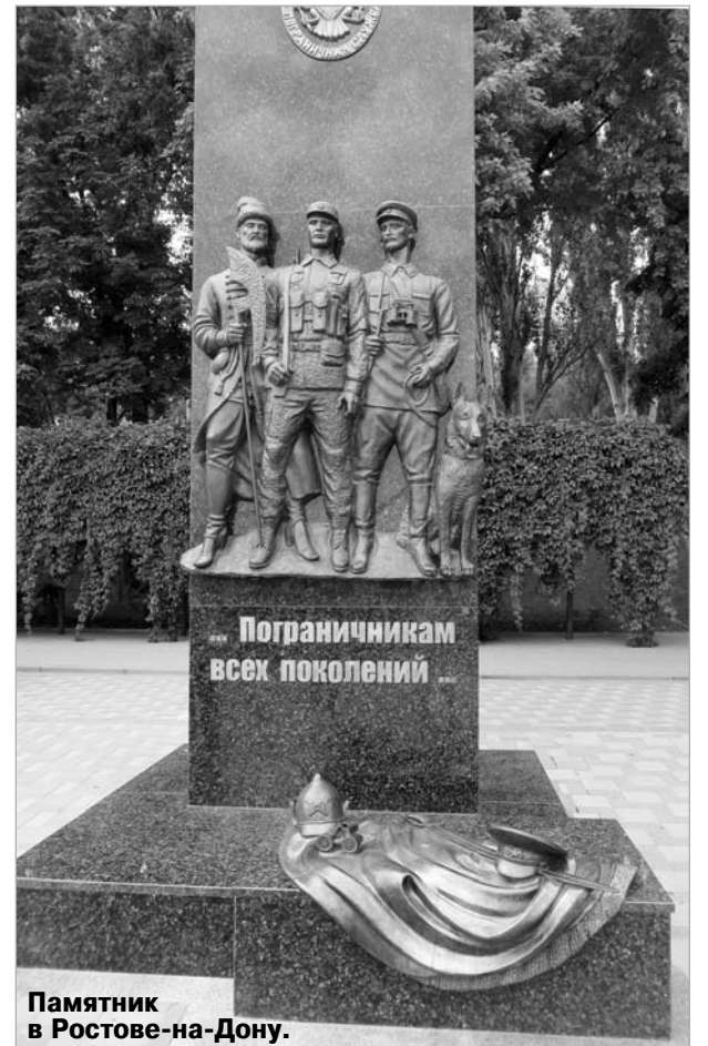
Памятник в Ростове-на-Дону.

оказалось, он стоит на постаменте от памятника Николаю 2. А фрагмент самого «царского памятника» расположен в одном из скверов Саратова как отдельная скульптура. Есть снимки памятных стел пограничникам на набережной Дона в Ростове и воинам-афганцам в Са-